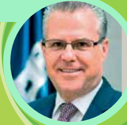
Pere Granados Alcalde de Salou

En aquest sentit s'escau celebrar i agrair la ferma voluntat, l'esforç i el treball de tothom, perquè en aquests 24 anys tota la societat salouenca ha estat la protagonista destacada en la construcció del Salou actual, que esdevé un patrimoni i un èxit de tots i, que per tant, fa que tots haguem de celebrar aquesta festa tan nostra com és la del 30 d'Octubre.